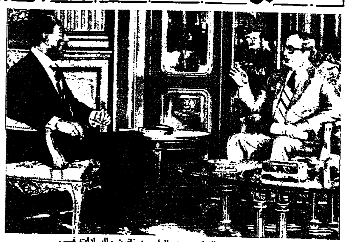
جولة المحادثات الاولى بين الرئيسين ناسون والسادات قسي قصر عابدين